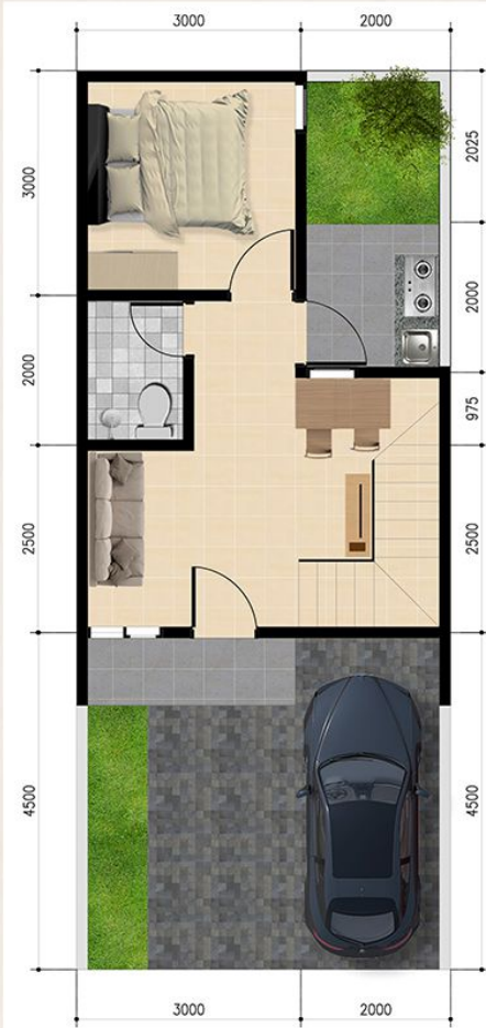
DENAH LANTAI DASAR SKALA 1 : 75