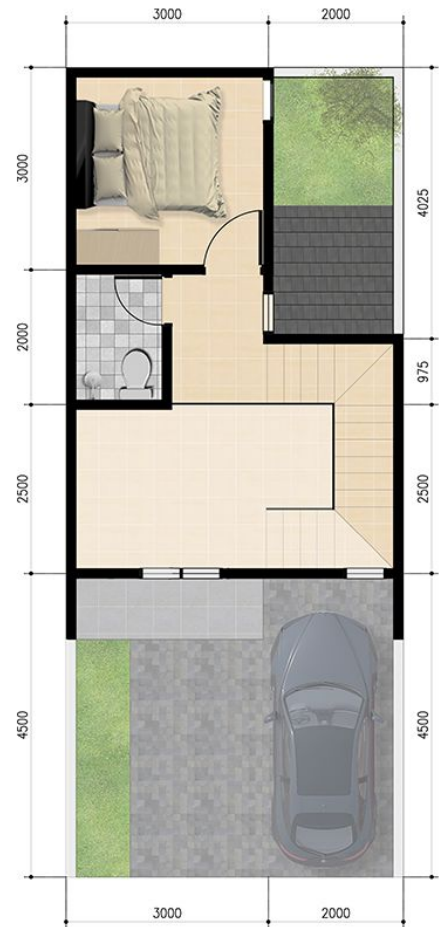
DENAH LANTAI ATAS SKALA 1 : 75

PONDASI : Lajur Batu Belah, SLOOF, KOLOM & RINGBALK : Beton bertulang, DINDING : Pas Bata Merah, Plesteran, Cat, LANTAI R. dalam : Granit Tile 60 x 60cm, Lantai Teras : Granit Tile 60 x 60cm, PLAFON : Gypsum Rangka Hollow,