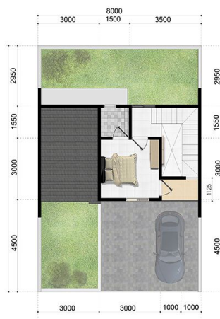
DENAH LANTAI ATAS