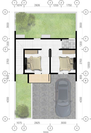
DENAH L2 ATAS