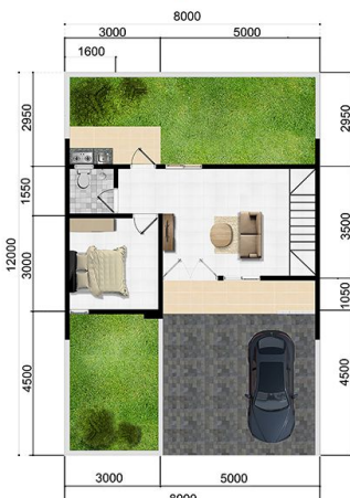
DENAH LANTAI DASAR

Lantai Bangunan 57M 2 / Luas Tanah 96 M 2