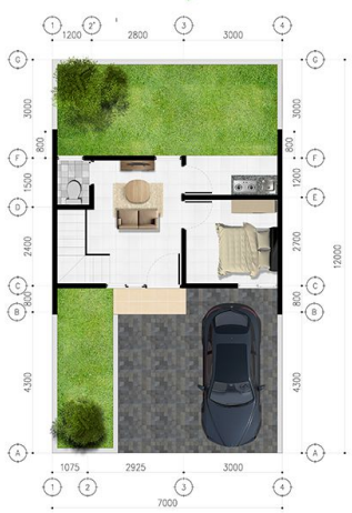
DENAH L1 DASAR

Lantai Bangunan 52M 2 / Luas Tanah 84 M 2